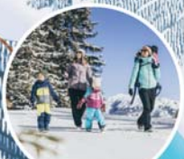
15 km Wanderwege